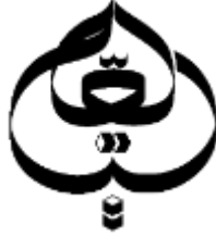
الشكل 1: شعار همتي

فإن الأسس الفلسفية تتعلق بطريقة الحياة المعتمدة (Maftoon & Safdari, 2018). وفي كتاب همتي توجد الأسس الفلسفية في شعاره.