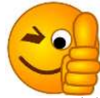
الشكل 3: تعبير الإبهام

يدل الشكل 4 على نموذج التقويم الثاني في كتاب همّتي. وتكون معه الجملة "مبروك! تتجج في هذا المجلد وتنتقل إلى المجلد التالي" تعدّ هذه الجملة للمتعلمين الذين يبهون قراءتهم جيدة.