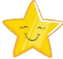
الشكل 4: تعبير النجم

يدل الشكل 2 على نموذج التدرج للمواد التعليمية في كتاب همّتي. وهو التدرج الدوري الذي يكون التعلّق بين المادة الأولى والثانية وما فوقها. ولا فهم المواد العليا إلا بعد فهم المواد الدنيا (Al-Rajjhi, 1995; Corder, 1973). وتكون الرموز T, U, V, W, X, Y, Z تدل على جوهر المواد التعليمية في كل المجلد في كتاب همّتي. هذه تعني أن كفاءة التعلم ستزداد مع زيادة رقم المجلد. واختلاف الألوان في نموذج التدرج السابق معتمد من تسلسل ألوان قوس قزح من الأحمر، البرتقالي، الأصفر، الأخضر، الأزرق، النيلي، إلى الأرجواني. حقيقة، يقع هذا التسلسل وفقاً لصغار التكرار الضوئي وكباره، من الأحمر هو الأصغر إلى الأرجواني هو الأكبر (Bharadwaj, 2017). والغرض من اختيار هذا الترتيب هو دعاء المؤلفة على الذين يتعلمون القرآن باستخدام همّتي أن مستوى معرفته سيزداد بقدر التكرار الضوئي بترتيب الضوء المرئي (Istiqomah, 2019). إضافة إلى ذلك، توجد الأسس السيكولوجية أيضاً في تقديم التقويم البسيط في كتاب همّتي. يتم تقديم التقويم الرئيسي في نموذجين: